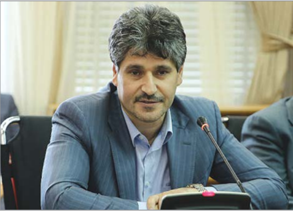
گروه صنت گفت و گو

فولاد مبارکه برای نخستین بار تختال مورد نیاز خط لوله نفت بوشهر به جاسک را تامین می کند