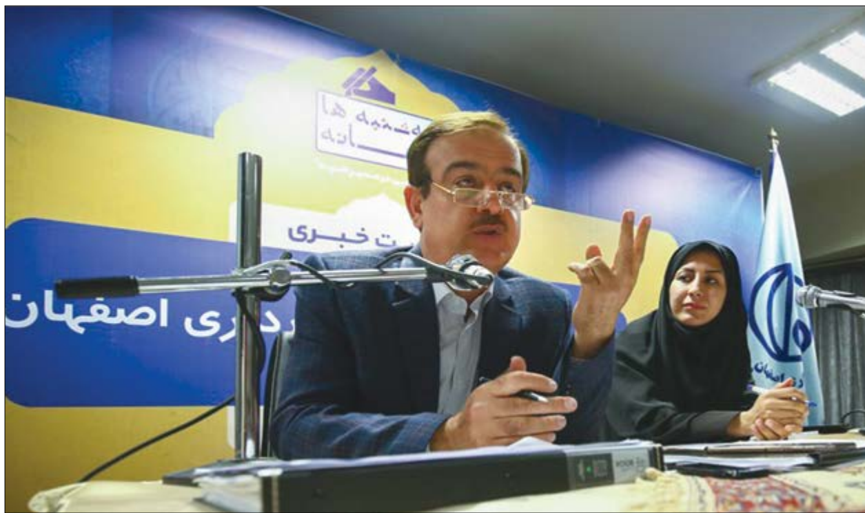
گروه شهری گزارش

طرح گردشگری پارک کوهستانی قائمیه در سال ۹۹ اجرایی می شود