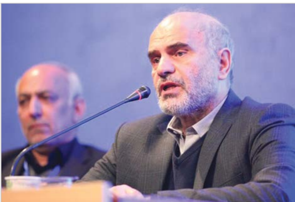
گروه اقتصاد گزارش

در بستر نهادی ضد تولید و کج کارکرد و پرفساد، قرارداد خارجی به زبان ما تمام خواهد شد