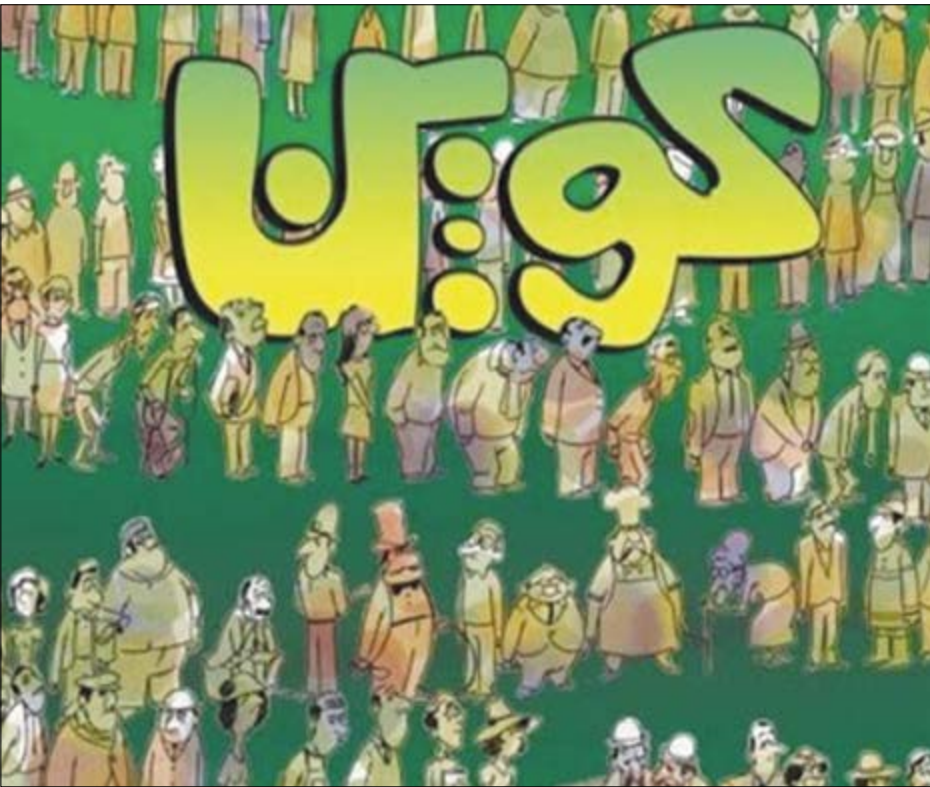
گروه بازار گانی گزارش

اقتصاد ایران به جای کوپن، نیازمند تعدیل بار روانی و تعامل با بخش‌های داخلی و خارجی است